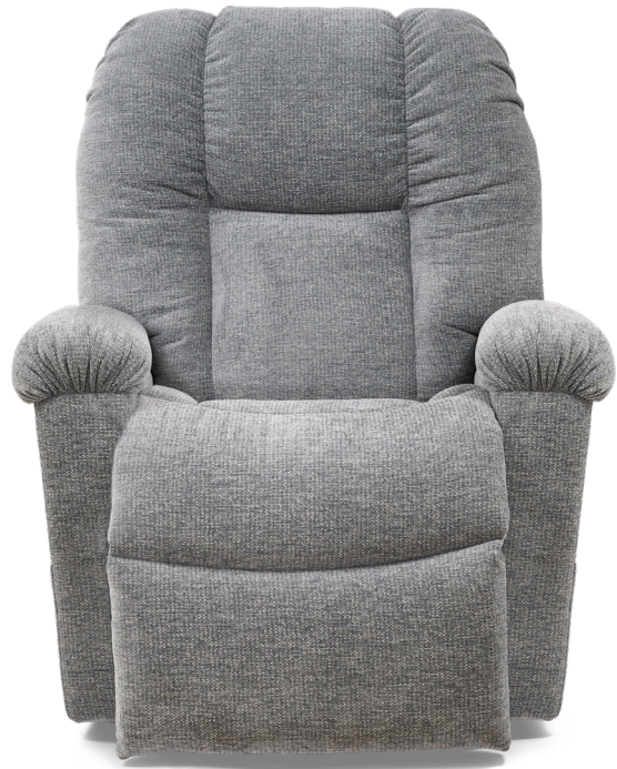
Présenté en Slate

Le fauteuil releveur à positionnement électrique le plus avancé au monde, doté de la technologie Twilight brevetée !