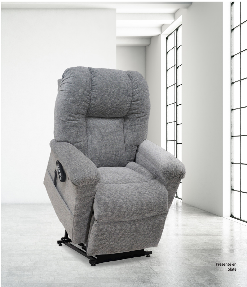
Présenté en Slate