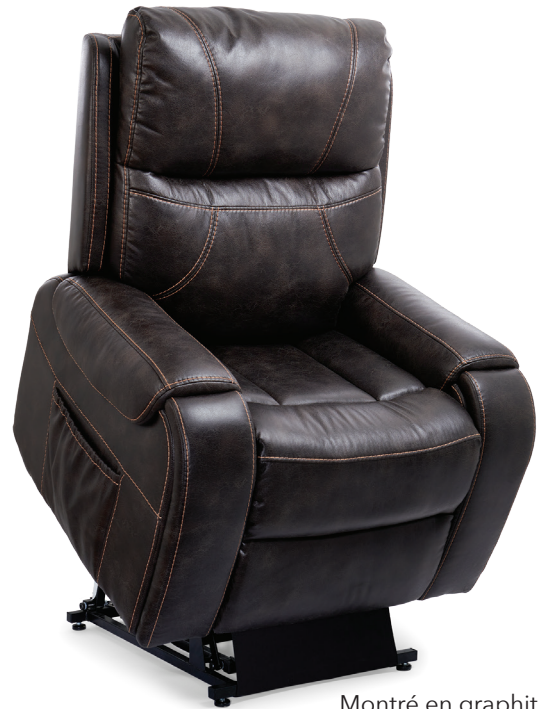
Montré en graphite