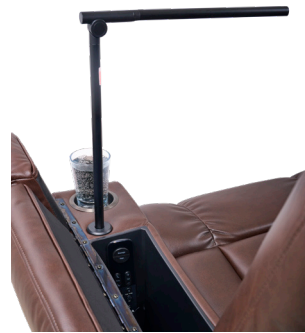
Port d'alimentation + lampe de lecture LED