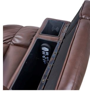
Accoudoir droit : Chargeur sans fil et compartiment de rangement