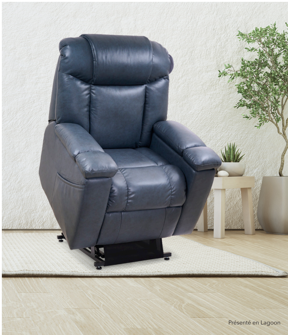
Présenté en Lagoon