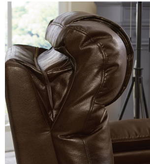
Appui-tête & lombaire réglables