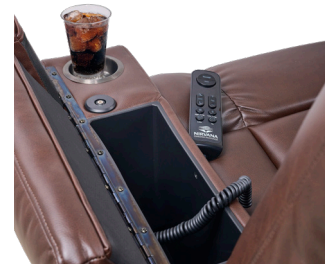
Accoudoir gauche : Portegobelet, prise électrique et compartiment de rangement