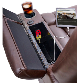
Porte-gobelet, prise électrique, port de chargement USB et compartiment de rangement