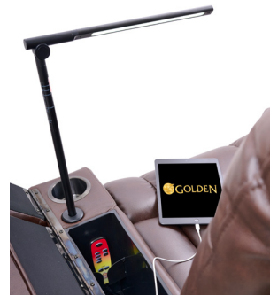
Lampe de lecture LED amovible et table-plateau