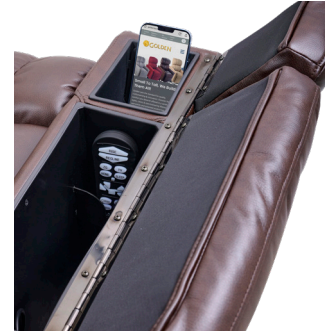
Chargeur sans fil pour smartphone et compartiment de rangement