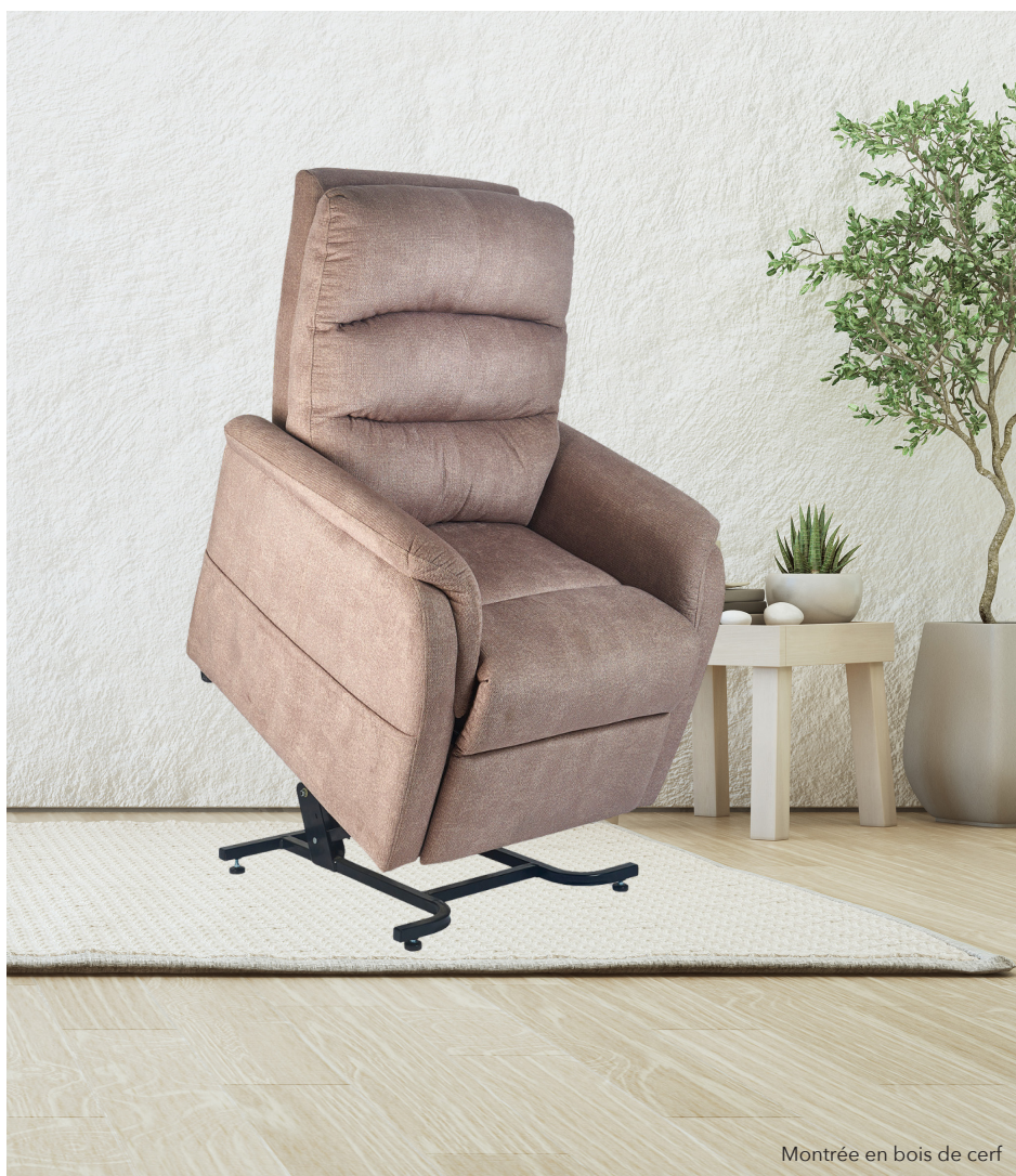
Montrée en bois de cerf