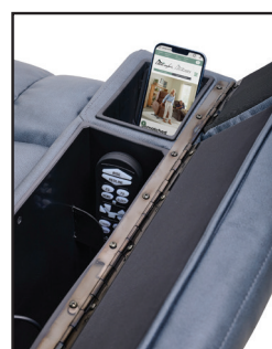
Chargeur sans fil et compartiment de rangement