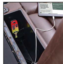
Port de chargement USB et compartiment de rangement