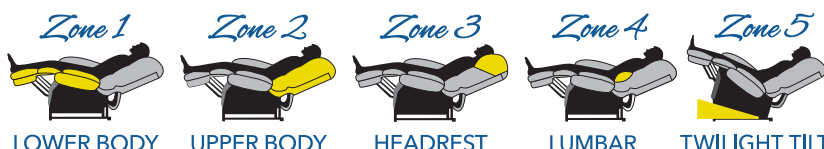
LOWER BODY UPPER BODY HEADREST LUMBAR TWILIGHT TILT