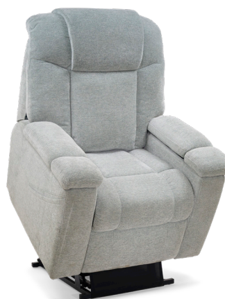
Conception à bras ouverts