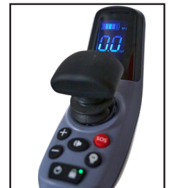
Contrôleur pour droitier ou gaucher