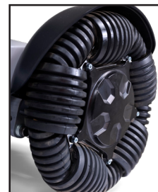
Roues omnidirectionnelles avec rainure en V autonettoyante