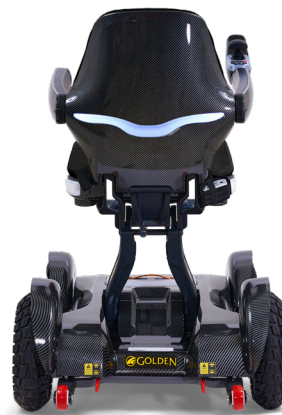
Le style high-tech comprend des éclairages latéraux et arrière très visibles