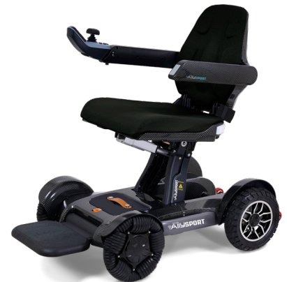
Montrée en fibre de carbone noire