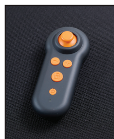
Télécommande sans fil