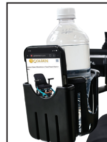
Porte-gobelet/support pour téléphone