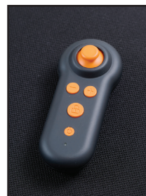
Télécommande sans fil