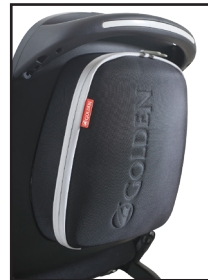
Sac à dos résistant à l'eau avec fermeture à glissière