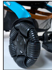
Roues omnidirectionnelles avec rainure en V autonettoyante