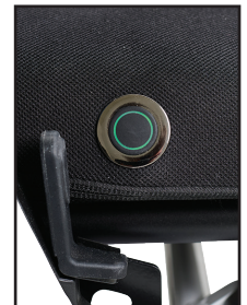
Commande de sièges chauffants