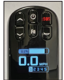
Contrôleur précâblé pour un placement à droite ou à gauche