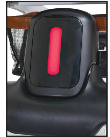
Éclairage arrière très visible