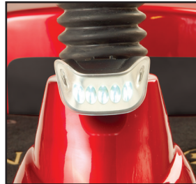
Feux avant et arrière et réflecteurs latéraux pour la sécurité