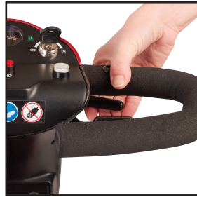
Réglage automatique et convivial de la barre franche