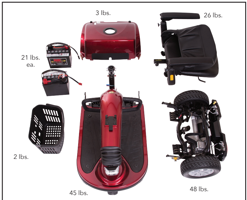
Démontage facile !