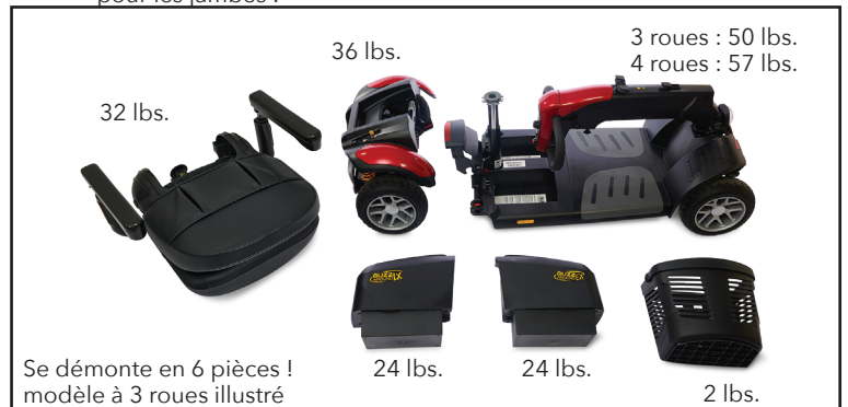
Se démonte en 6 pièces ! modèle à 3 roues illustré