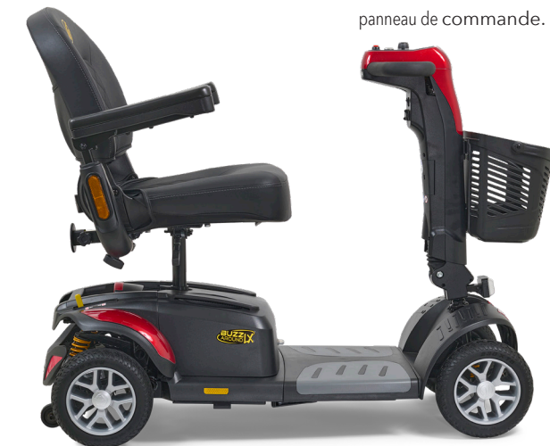
5. Un nouveau profil élégant offre un grand espace pour les jambes !