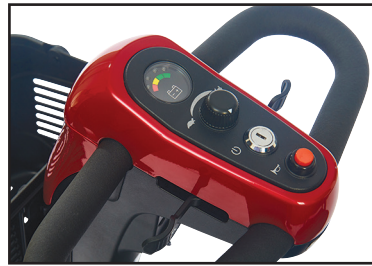
1. Un timon réglable à l'infini (sans articulation) au bout des doigts !