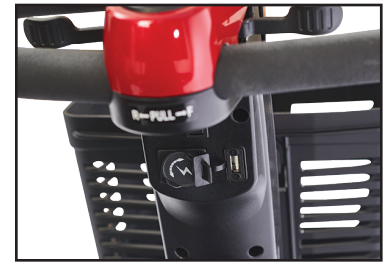
4. Ports USB et de chargement de la batterie commodément situés sur la barre sous le panneau de commande.