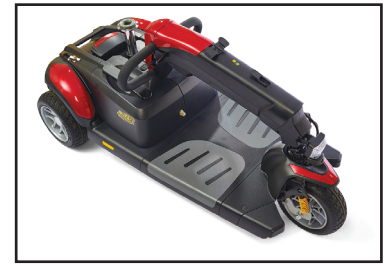
2. Le timon se plie facilement et se verrouille en place.