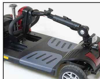
Étape 3 : Rabattre le timon et le verrouiller en place !