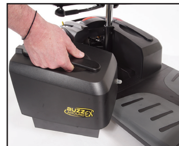
Étape 2 : Retirez la batterie !