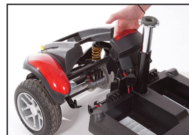
Étape 4 : Tirez vers l'avant le levier de déverrouillage de la transmission pour séparer les sections avant et arrière du cadre !