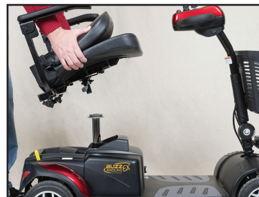
Étape 1 : Enlevez le siège !