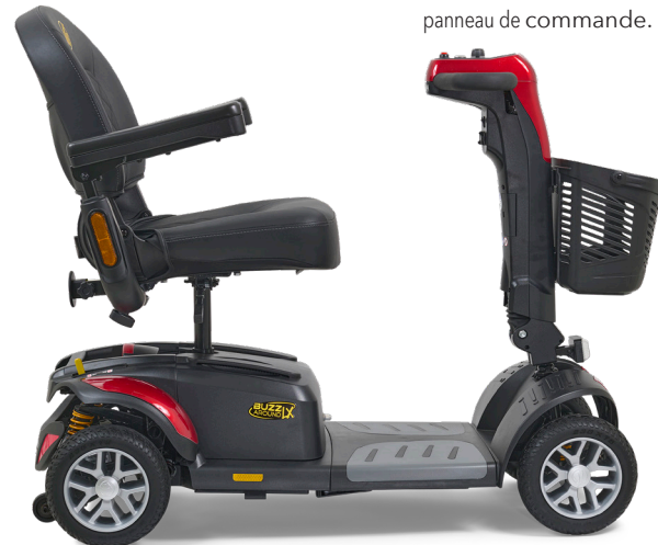
5. Un nouveau profil élégant offre un grand espace pour les jambes !